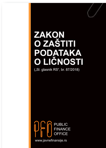
Zakon o zaštiti podataka o ličnosti